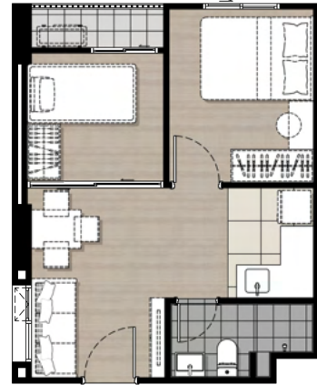
1BP1 34.55 - 34.85 sq.m.