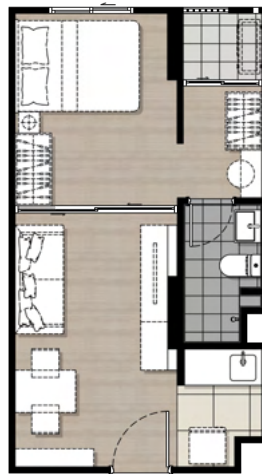
1B5 30.20 - 30.50 sq.m.