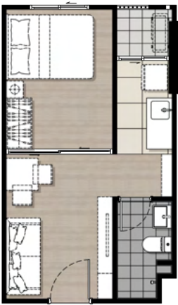
1B1 26.70 - 27.00 sq.m.