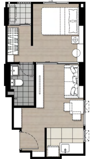
1B9 32.15 - 32.20 sq.m.