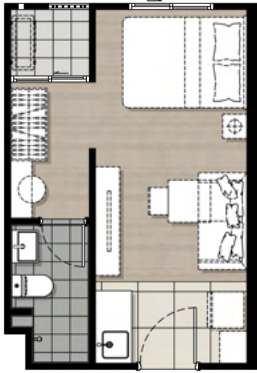
S1 23.20 sq.m.