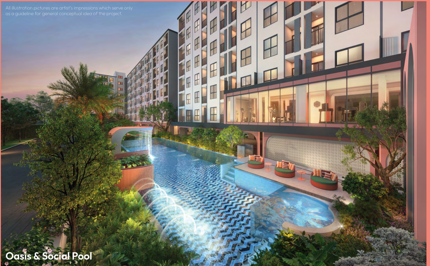
Oasis & Social Pool

All illustration pictures are artist's impressions which serve only as a guideline for general conceptual idea of the project.